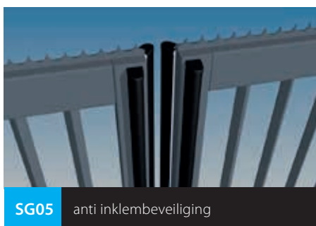
SG05 anti inklembeveiliging