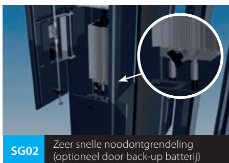
SG02 Zeer snelle noodontgrendeling (optioneel door back-up batterij)