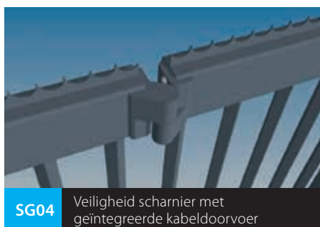
SG04 Veiligheid scharnier met geïntegreerde kabeldoorvoer