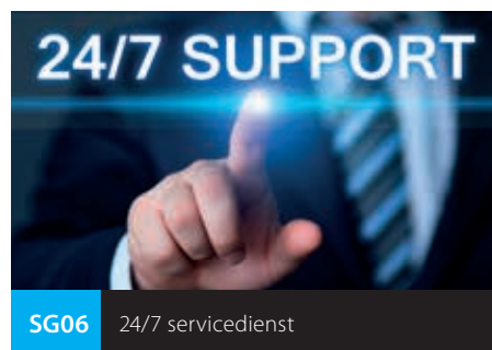
SG06 24/7 servicedienst