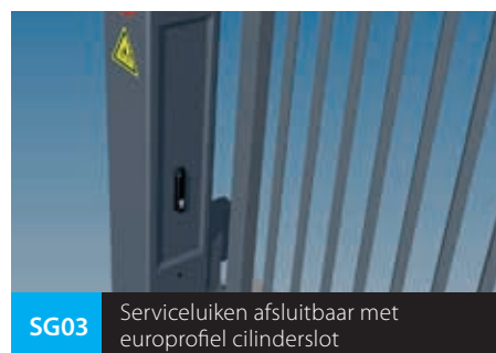
SG03 Serviceluiken afsluitbaar met europrofiel cilinderslot